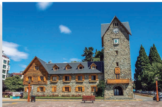
BARILOCHE CENTRO CIVICO